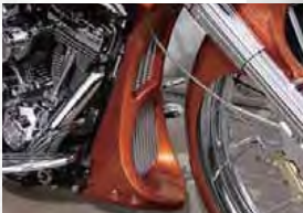
PHANTOM CHIN SPOILER ポルトオン設計 価格 ¥60,000