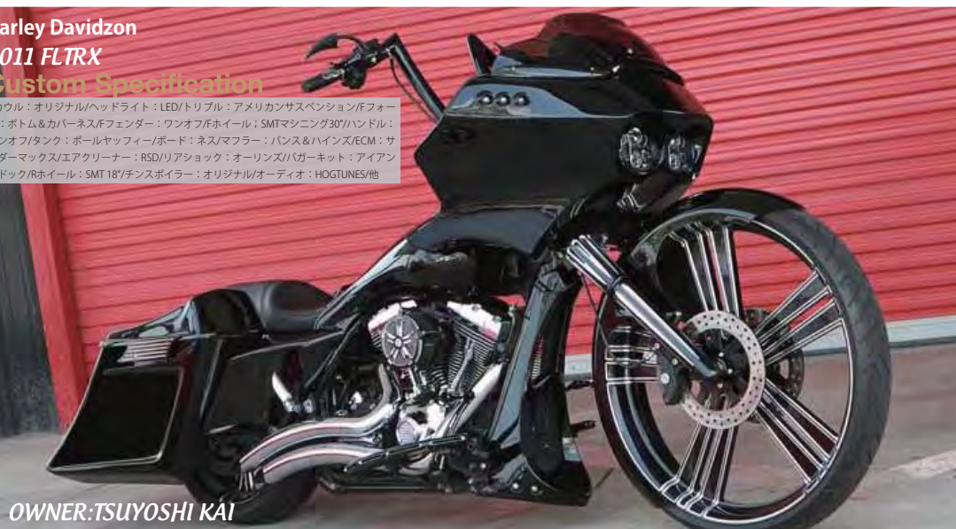
OWNER: TSUYOSHI KAI

Fカウル: オリジナル/ヘッドライト: LED/トリプル: アメリカンサスペンション/Fフォー ク: ボトム&カバーネス/Fフェンダー: ワンオフ/Fホイール: SMTマシニング30"/ハンドル: ワンオフ/タンク: ホールヤッフィー/ボード: ネス/マフラー: パンス&ハインズ/ECM: サ ンダーマックス/エアクリナー: RSD/リアショック: オーリンズ/バガーキット: アイアン パッド/Rホイール: SMT 18"/チンスポイラー: オリジナル/オーディオ: HOGTUNES/他