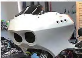
PHANTOM FRONT FAIRING FLTR 2000~2012年装着可能 価格 ¥230,000