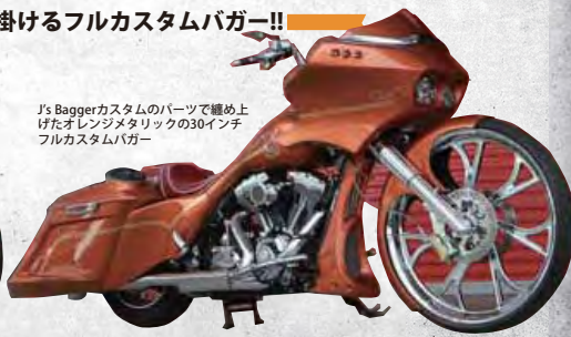
J's Baggerカスタムのパーツで纏め上げたオリジナルの30インチフルカスタムバガー