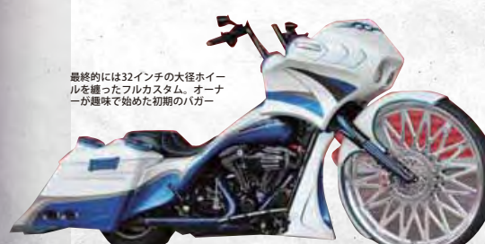
最終的には32インチの大径ホイールを纏ったフルカスタム、オーナーが趣味で始めた初期のバガー