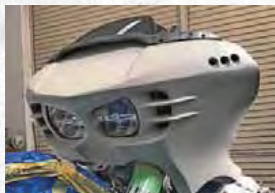
PHANTOM FRONT FAIRING FLTR 2014UP 装着可能 価格 ¥230,000