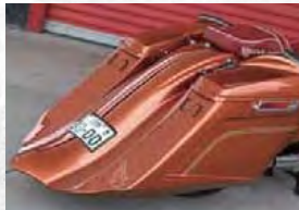
PHANTOM BAGGER KIT 3点KIT 2013UP 装着可能 価格 ¥298,000