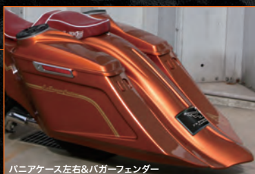
パニアケース左右&バグーフェンダー